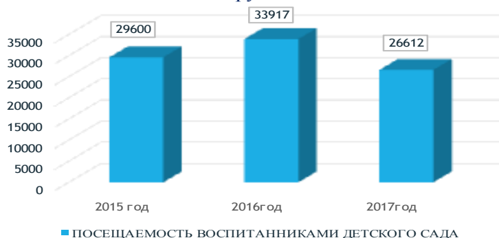
Число дней, проведенных воспитанниками в группе