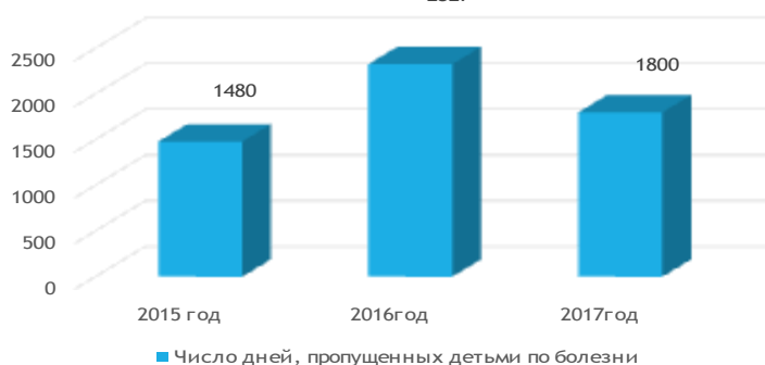
Число дней, пропущенных детьми по болезни

По результатам самообследования по сравнению с 2015–2016 и 2016–2017 учебными годами, был спад роста числа пропущенных дней детьми по болезни.